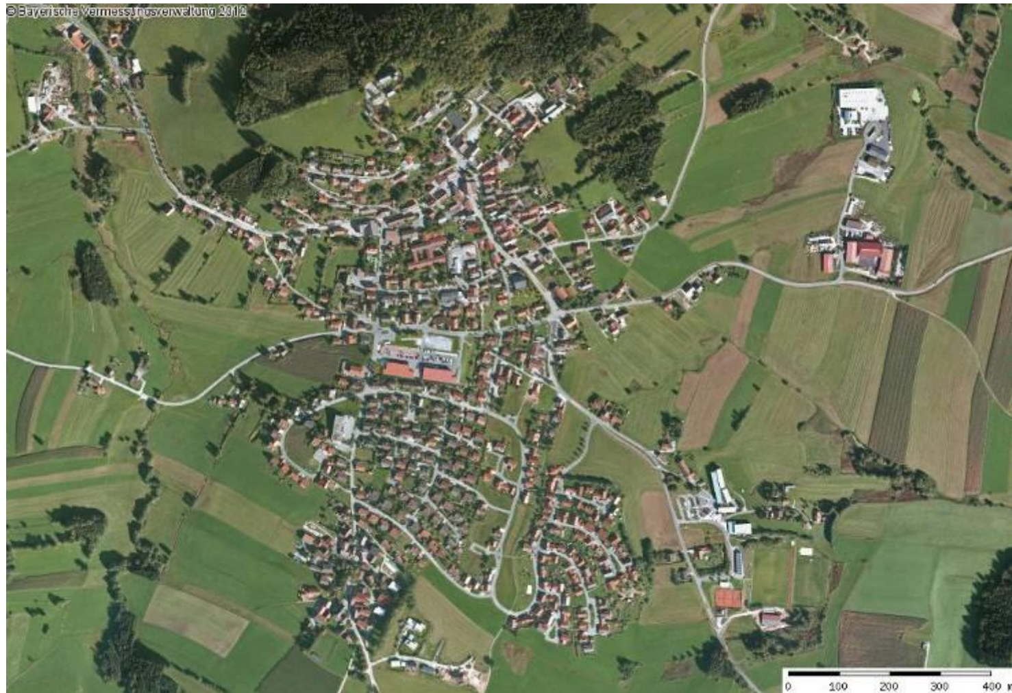
Kirchberg heute, mit neuer Schule, Sportgelände im Südosten und Gewerbegebiet im Osten